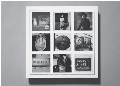
Sol LeWitt, Autobiography , 1980