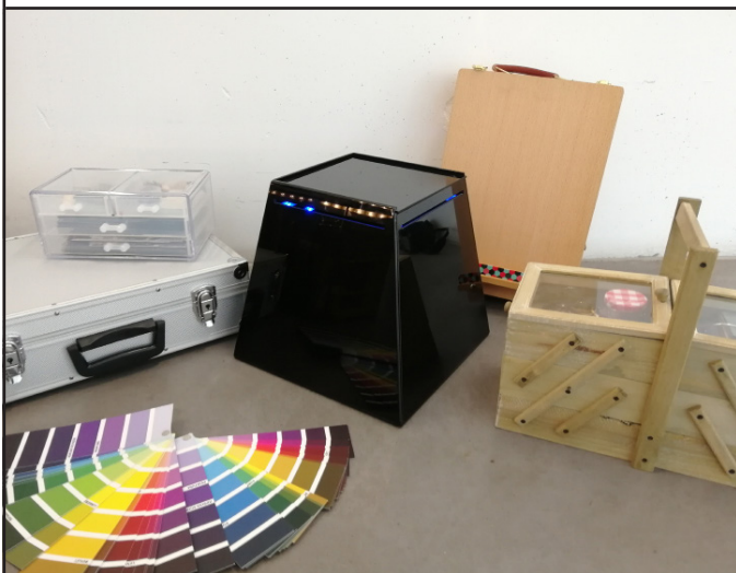
Les outils de regard

https://www.fracsud.org/Dossiers-pedagogiques-des-expositions