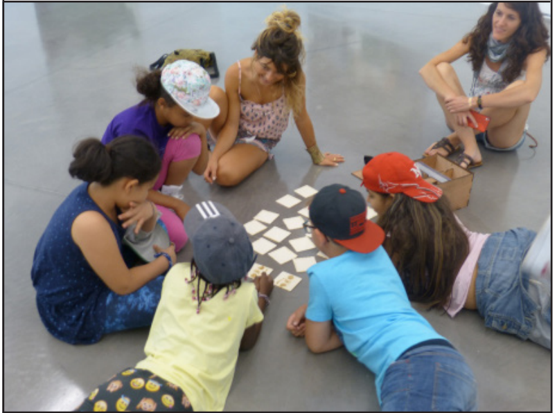
Les outils de regard

Ces outils peuvent également devenir nomades et accompagner le prêt d'œuvres.