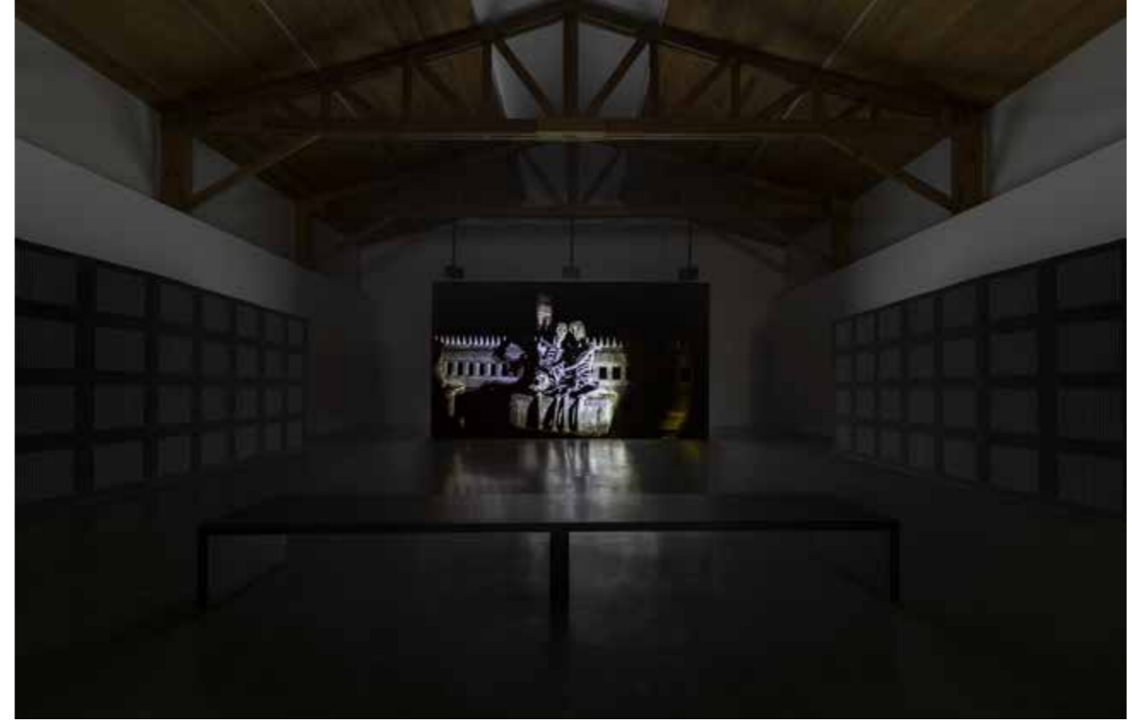
Apichatpong Weerasethakul, Fireworks (Archives) 1 , 2014, installation vidéo, HD, couleur, 16 : 9, 6 min 40 sec en boucle. Collection Frac Provence-Alpes-Côte d'Azur.