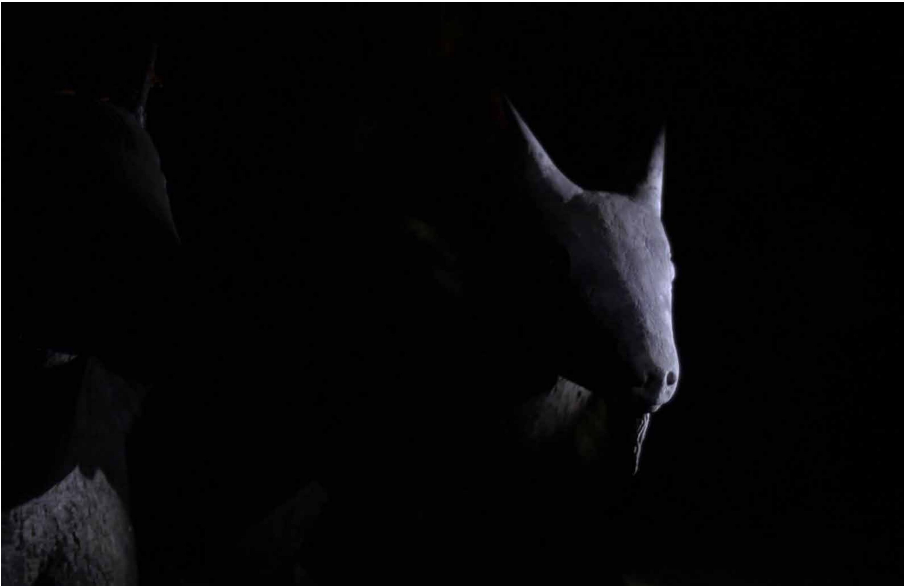
Apichatpong Weerasethakul, Fireworks (Archives) 5 , 2014, installation vidéo, HD, couleur, 16 : 9, 6 min 40 sec en boucle. Collection Frac Provence-Alpes-Côte d'Azur.