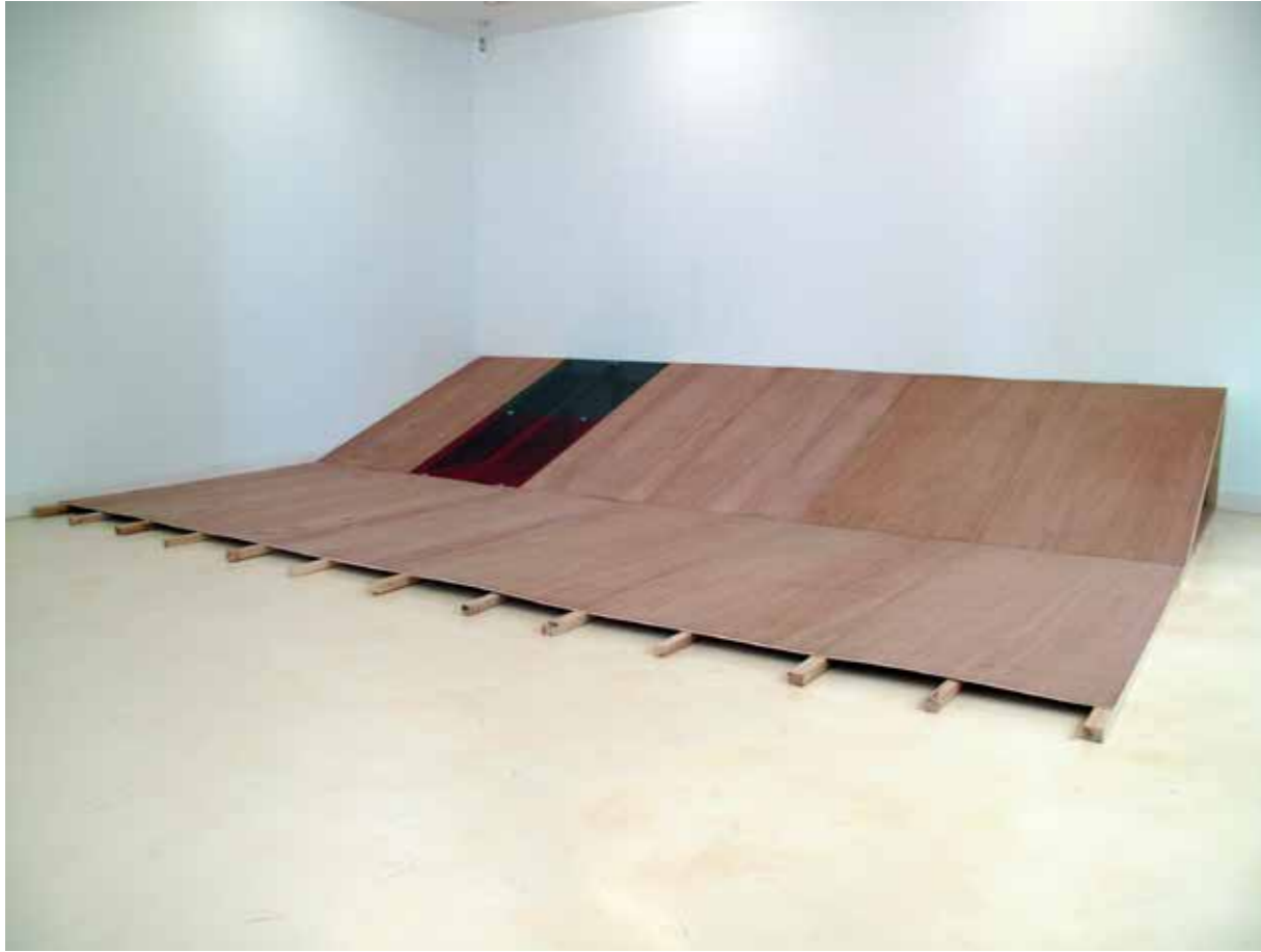
Ramiro Guerreiro, Sala para Performance , 2011, installation.