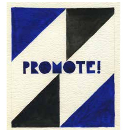
Ramiro Guerreiro, The T.I.N.A. Pamphlet , 2017.